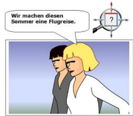
By Gert Egle – www.teachsam.de – lizenziert unter CC-BY-SA 4.0 International license

Allerdings muss man bei diesem Lösungsvorschlag berücksichtigen, dass man die Äußerung unter der Kommunikationslupe unterschiedlich sehen kann. Das hängt vor allem von der jeweiligen Situation, in der die Äußerung gemacht wird und der Beziehung der Gesprächspartner zueinander ab. Davon bestimmt ist dann vor allem auch der Aspekt der Selbstoffenbarung.