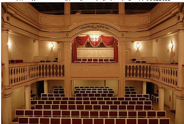
Zuschauerraum des Ekhof-Theaters