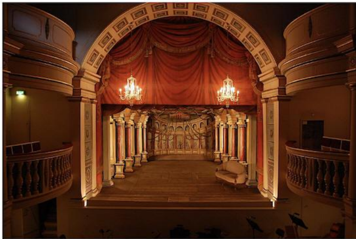
Bühne des Ekhof-Theaters

Die Raumkonzeption barocker Theater spiegelt die gesellschaftlichen Verhältnisse der Zeit wider.: