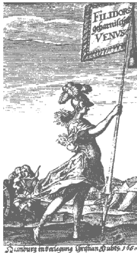
Hamburg in Verlegung Christian Gubitz 1660

Die Geharnschte Venus oder Liebes-Lieder im Kriege gedicht- tet mit neuen Gesangs-Weisen zu singen und zu spielen gesezset nebenst ettlichen Sinnreden der Liebe Verfertiget und lustigen Gemüthern zu Gefallen heraus gegeben von Filidor dem Dorfferer. HAMBURG / Gedruckt bey Michael Pfeifferr. In Verlegung Christian Gubitz Buchhänd- lers im Luthro/Im Jahr 1660,