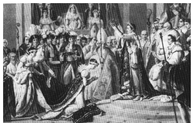
Kaiserkrönung Napoleons 2.12.1804 - Napoleon krönt seine Gattin